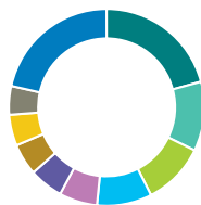
Répartition géographique (%)