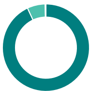
Répartition de l'actif (%)