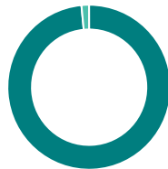
Répartition géographique (%)