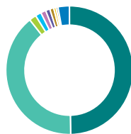
Répartition géographique (%)