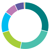
Répartition de l'actif (%)