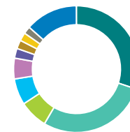
Répartition sectorielle (%)