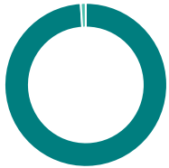
Répartition de l'actif (%)