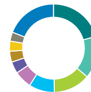
Répartition sectorielle (%)