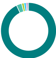
Répartition géographique (%)