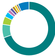
Répartition géographique (%)