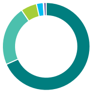
Répartition de l'actif (%)